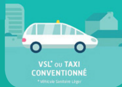
VSL* ou TAXI CONVENTIONNÉ *Véhicule Spécialisé Léger

VOUS AVEZ BESOIN D'UNE AIDE POUR VOUS DÉPLACER, vous risquez des effets secondaires pendant le transport ou votre état de santé nécessite le respect rigoureux des règles d'hygiène.